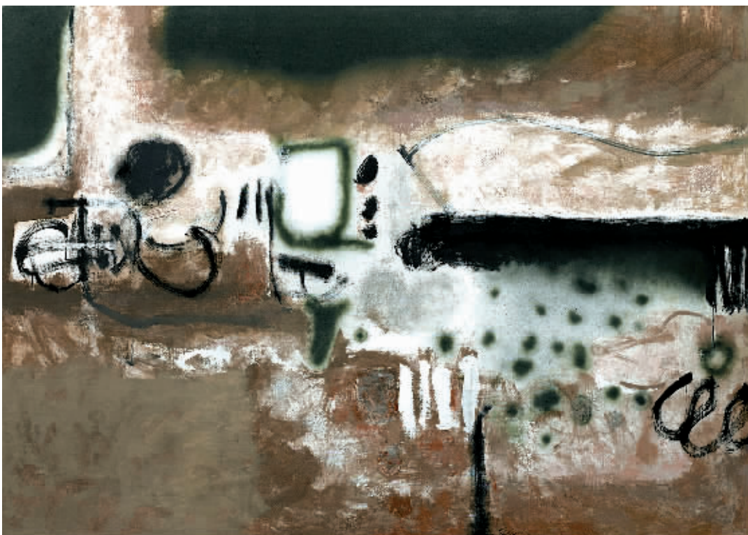
▲ 互补系列 0704 周长江

我们有充分的理由相信，当代抽象艺术家们所提供的视觉经验，随着时间的推移，必定能够实现与大众接受者之间的沟通与交流。虽然这需要通过艰苦的努力，建立与之相适应的审美活动手段和平台，但这种可能性却是切实存在的。由周长江、谭平、邓国源、杨劲松和李磊组合的“时代年轮——中国抽象艺术五人展”便是一个颇具说服力的证明。他们不但是中国抽象艺术重要的代表性画家，而且他们的创作状态，也在相当程度上折射出中国抽象艺术的现实语境，成为中国抽象艺术具有典型意义的当代表述。从这个意义来看，这个展览更是作为一个事件而超越了展览本身，在当代艺术和文化精神的层面上有所建树。（“时代年轮”五人展今天在 M50 2 号楼展出）