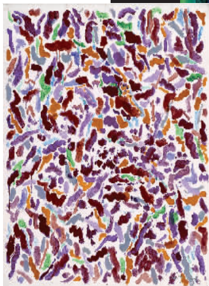
▲ 在田野 4号 邓国源