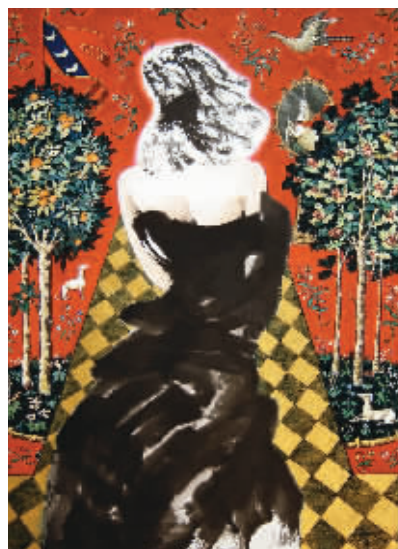
▲ 背影 周刚